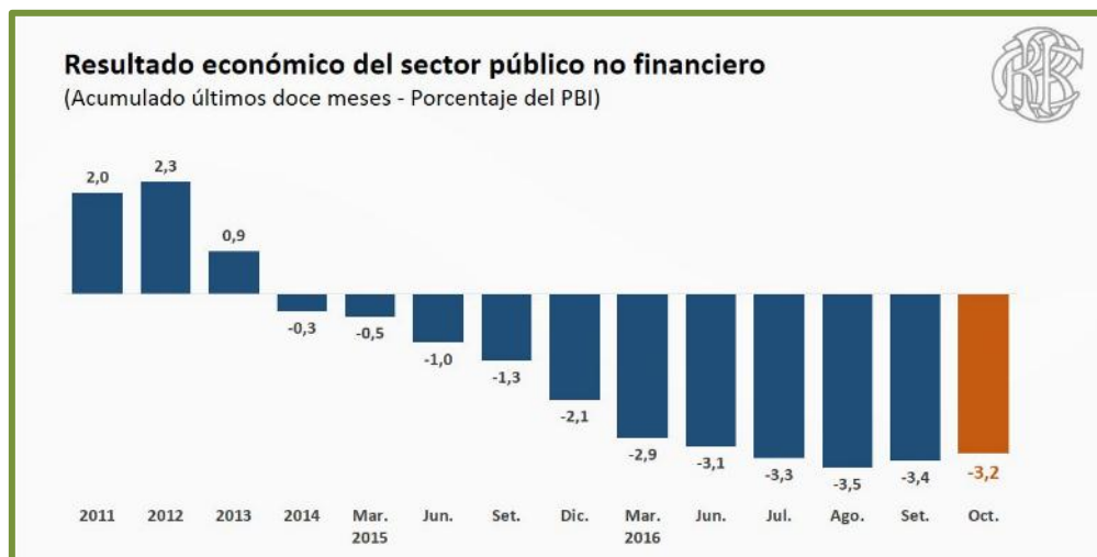
IMAGEN Nº 01 RESULTADO DE LA INVERSIÓN PÚBLICA 2011 – 2016. BANCO CENTRAL DE RESERVA DEL PERÚ

En un contexto en el cual la inversión pública sobre PBI se ha reducido en los últimos 4 años, la prioridad de la presente administración ha sido expandir la frontera de posibilidades de inversión del sector privado a través de las APP, aprovechando el incremento de la confianza de la inversión internacional y el sostenimiento de la estabilidad jurídica del País después de las elecciones generales 2016.